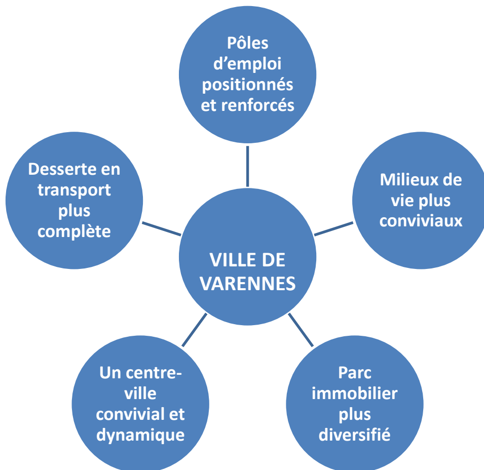
Figure 2 Grands défis de la Ville de Varennes

Ainsi, la Ville de Varennes doit réaffirmer son identité. À cet égard, Varennes se doit de saisir les multiples opportunités de développement pouvant s'offrir à elle, afin de favoriser une meilleure diversité et mixité des grandes fonctions économiques. Le diagramme ci-après illustre les axes d'intervention.